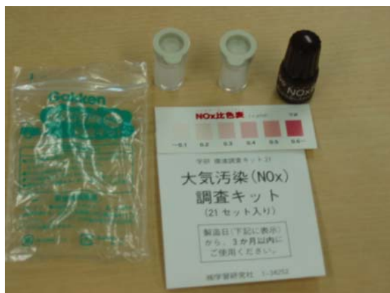
大気汚染(NOx)調査キットの例